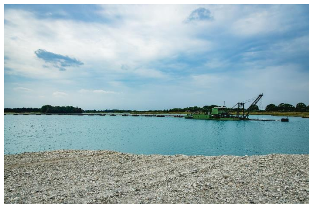
Figuur 2 – Zandzuiger (referentiebeeld)